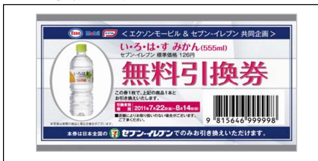
[セブン-イレブン ソフトドリンク無料引換券(写真は商品の一例)]