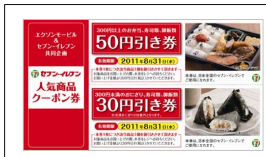
[セブン-イレブン 人気商品クーポン券(非レシートタイプ)]